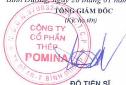
ĐỖ TIẾN SĨ